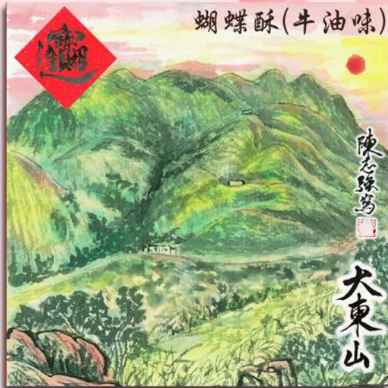
A1. 大東山 x 蝴蝶酥 (牛油原味) Tai Tung Shan x Palmier (Butter flavor)